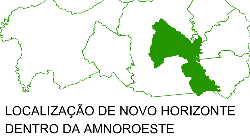
LOCALIZAÇÃO DE NOVO HORIZONTE DENTRO DA AMNOROESTE