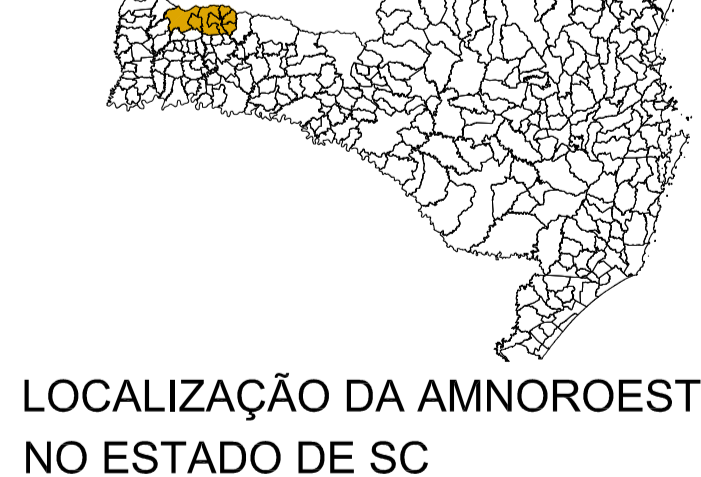
LOCALIZAÇÃO DA AMNOROESTE NO ESTADO DE SC