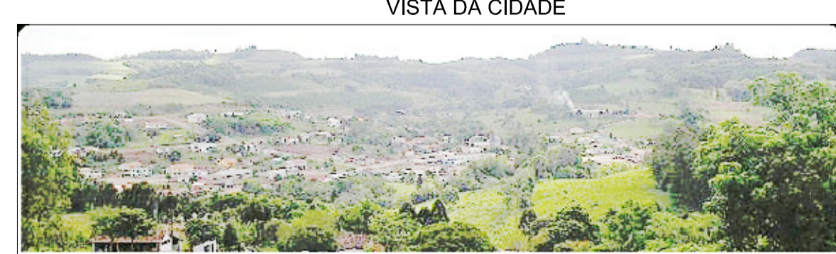
VISTA DA CIDADE