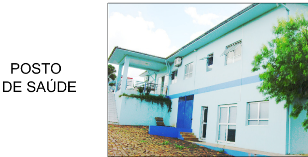
POSTO DE SAÚDE